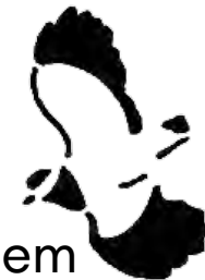
Landesorganisation Ala mit dem ornithologischen Beobachter